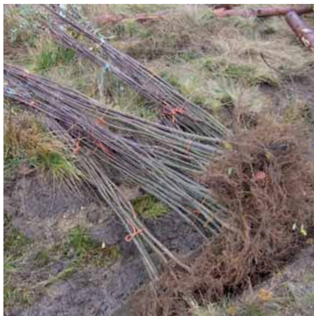
Obr. 1. Prostokořenné odrostky sazené na horských stanovištích

Doby trvání jednotlivých etap byly měřeny s přesností na sekundy. Součástí vyhodnocení je testování normality rozdělení časů trvání jednotlivých etap výsadby. Nulová hypotéza: rozdělení nebude odlišné od normálního. Ke zpracování a vyhodnocení dat byl použit software MS Excel, Statistica a Statgraph. Pro testování, zda rozdělení četností dob trvání jednotlivých etap má normální rozdělení, byl použit chí–kvadrát test dobré shody.